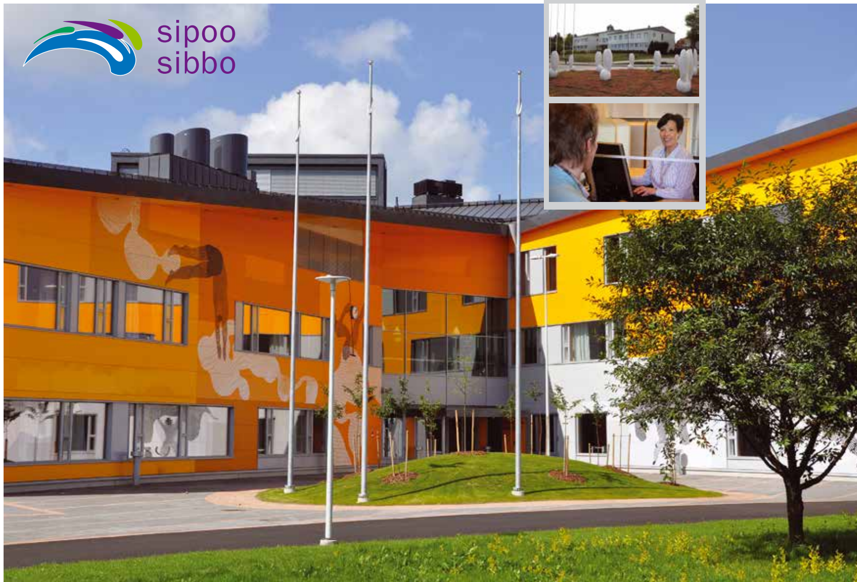
Nickby Hjärta - Nikkilän Sydän