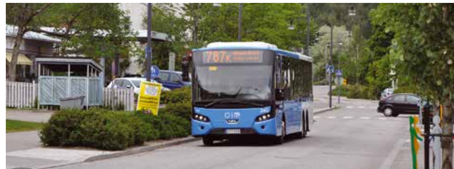
Nickby – Nikkilä