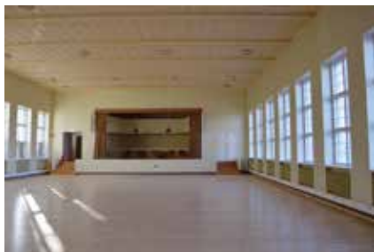
Den renoverade Festsalen i Östanåparken Itäisen jokipuiston kunnostettu Juhlasali