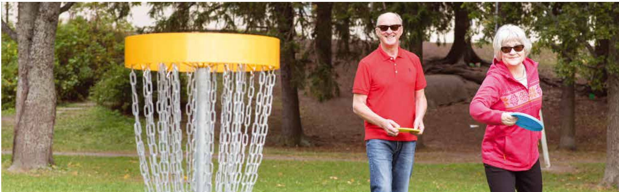
Frisbeegolf, Östanåparken – Frisbeegolf, Itäinen jokipuisto