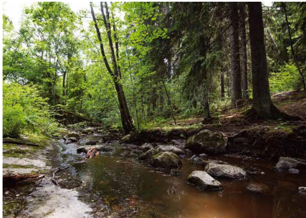
Sipoonkorpi – Sibbo storskog