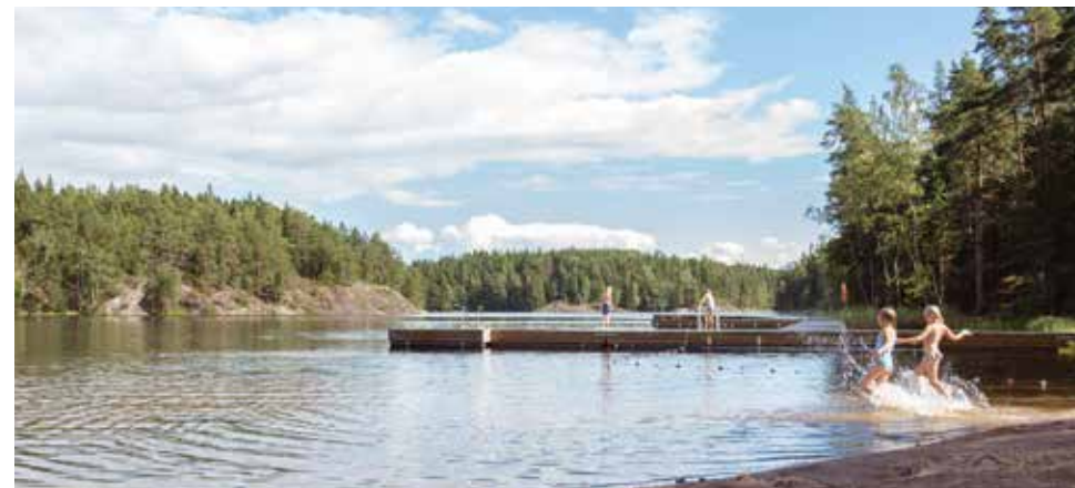
Molnträsk – Pilvijärvi