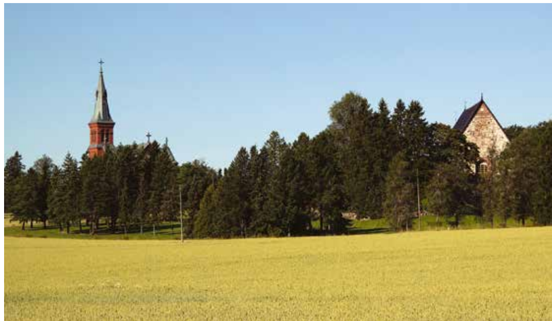
Sibbo kyrka och Sibbo gamla kyrka – Sipoon kirkko ja Sipoon vanha kirkko

Tilläggsuppgifter: Sibbo Hembygdsförening rf www.sibbo.hembygd.fi www.museo-opas.fi