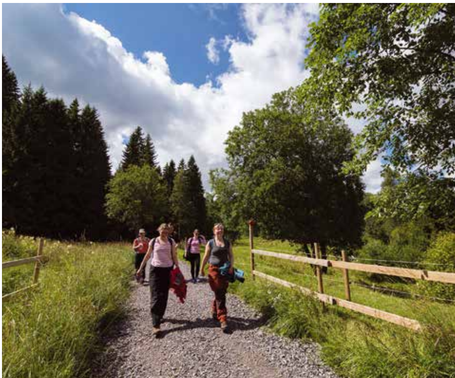
Sipoonkorpi – Sibbo storskog