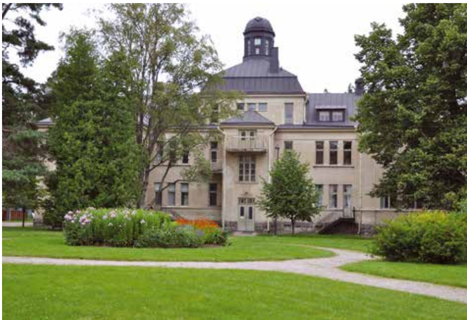
Östanåparken – Itäinen jokipuisto