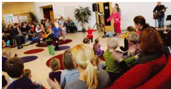
På biblioteket i Söderkulla. Söderkullan kirjastossa