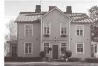
Iso Kylätie 11, Nikkilä 050-4621146